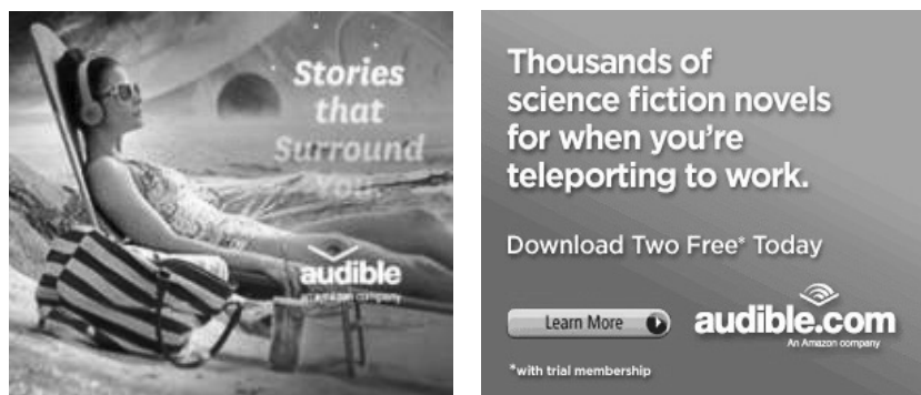
Рис. 2. Банери крамниці аудіокниг Audible. Написи на банерах зліва направо: «Історії, що вас оточують», «Тисячі творів наукової фантастики, щоб слухати під час телепортації на роботу. Завантажте сьогодні два безкоштовно»

Текстові елементи банерів Audible розповідають про такі особливості: прослуховування аудіокниги перебігає в двох реальностях одночасно — у реальному часі, що лунає в процесі читання, і в уявному часі, що існує у віртуальній реальності аудіокниги. При цьому «перебування» у віртуальній реальності аудіокниги часто суміщається з іншими діями — прибиранням, заняттями спортом, оскільки переводити зір та змінювати розташування у просторі можна незалежно від прослуховування. Пропозиція отримати будь-яку з аудіокниг безкоштовно сигналізує, що форма аудіокниги дозволяє тиражування та пересилку без витрат для крамниці або видавця. Це — цифровий завантажуваний файл. «Завантажуваний» значить такий, що не потребує матеріального носія, може бути завантажений з Інтернету.